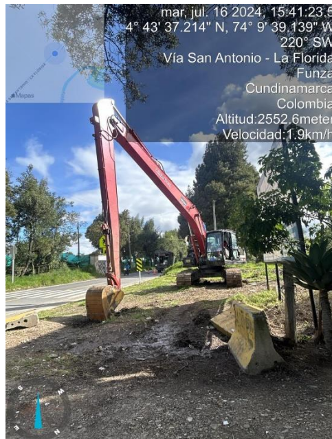
Ilustración 5. Maquinaria tipo excavadora brazo largo

C.P. 250020 Tel. +57(1) 823 40 70 823 40 71 / 823 40 73 Fax. + 57(1) 825 76 20 Dir. Cra. 14 No. 13-05