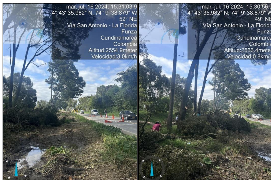
Ilustración 3. Acacias amarillas ( Acacia decurrens ) y Acacias japonesas ( Acacia melanoxylon )

De la inspección, se identificó la tala de más de 15 (quince) individuos arbóreos en el costado izquierdo de la vía perimetral de la vereda la Florida, en la ronda del Canal Chicú, el cual hace parte del sistema hidráulico de manejo ambiental y de control de inundaciones de la Ramada, establecido en el acuerdo CAR 037 del 19 de diciembre de 2014, individuos de las especies acacias amarillas ( Acacia decurrens ) y acacias japonesas ( Acacia melanoxylon ), como se muestra a continuación: