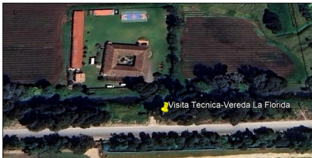
Ilustración 1. Ubicación visita técnica - Vereda La Florida

Teniendo en cuenta que ante el municipio de Funza se interpuso queja por tala de árboles en espacio público, el día 16 de julio personal adscrito a la Secretaría de Ambiente y Bienestar Animal realizó inspección, de conformidad con el acta de visita ambiental No. 102, en la vereda La Florida (ver ilustración 1), coordenadas 4°43'37.182" N y 74°9'38.990" W, como se muestra en la ilustración 2: