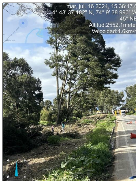
Ilustración 2. Tala de árboles